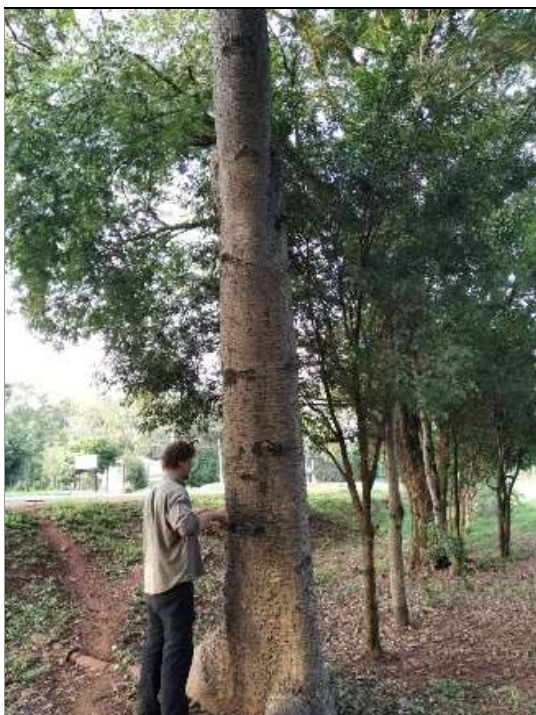
Imagen n°1: Técnica de medición del diámetro del tronco a la altura del pecho. Herramienta de medición Forcipula