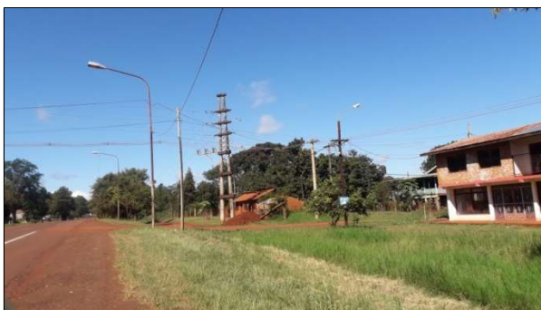
Inicio de traza Montecarlo

Para este relevamiento e inventario de los árboles mayores a 15 cm de DAP , se midieron los individuos que se encuentran afectados por la traza del proyecto de tendido eléctrico en Nacional N° 12, desde el acceso a Puerto Piray hasta la estación transformadora eléctrica en Montecarlo, una traza de 11 km.