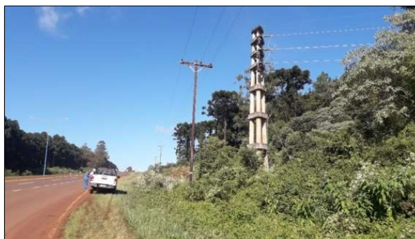
Fin de Traza Pto. Piray

Para el relevamiento se midió a cada individuo, tanto la altura como el diámetro del tronco a la altura del pecho ( ver imagen n°1 ).